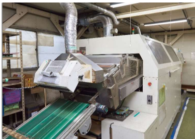
半田槽 SENSBEY (ILF-350HX)