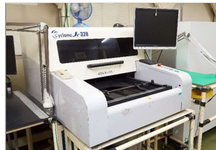
半田検査機 (共晶) ニッケ サイクロン