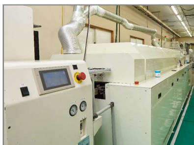
マウンタライン 1 (PB FREE)