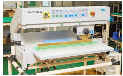
基板分割機 CAB (MAESTRO 4S)