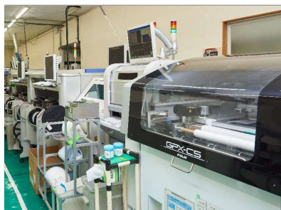
マウンタライン 2 (PB FREE)