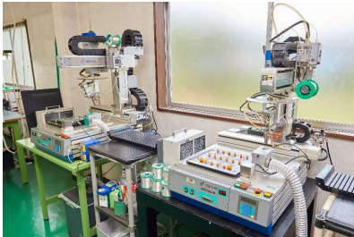
半田ロボット TSUTSUMI (MINIMAXIV)