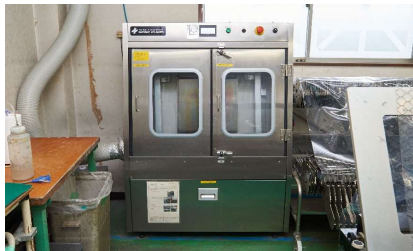
マスク洗浄機 SAWA CLEAN