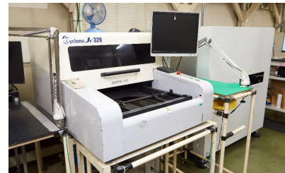
基板外観検査 ニッケ (サイクロン320)