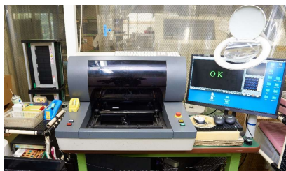
基板外観検査 MEK (M22XFMA-350)