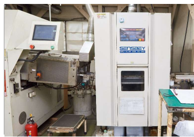
スプレーフラクサー SENSBEY (MXL-350V)