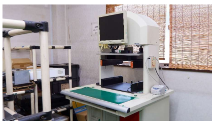
ICT Kyoritsu (F-2000)