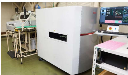
基板外観検査 SAKI (3Di-LS2)