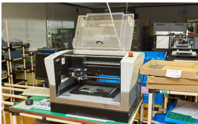
基板分割機 Roland (EGX-350)